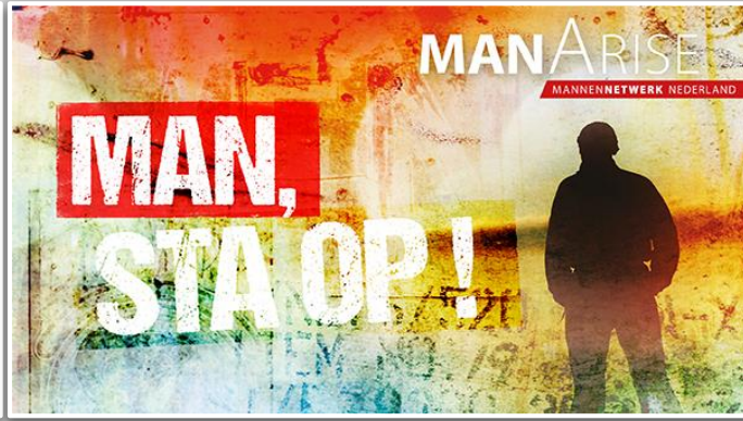
ManArise 28-29 november 2014 AMBT Delden