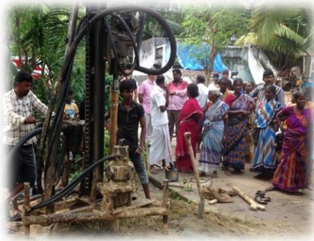
Het slaan van de pompen in de dorpen

Vorig jaar november zagen we tijdens het 'Living-Water-Festival' duizenden arme Dalits naar voren komen om Jezus aan te nemen. Dat was geweldig, maar tegelijk vroegen we ons af hoe hun geloofstand zou kunnen houden, aangezien deze Dalits nauwelijks kunnen lezen en schrijven. Omdat we ons verantwoordelijk voelen, hebben we nagedacht hoe we deze jonge gelovigen verder konden helpen. En zo ontstond de visie om in alle 50 dorpen, waar we ook al waterputten hadden geslagen, kerken te gaan bouwen. We hebben dit plan "Een kerk voor een kerk" genoemd. Ondertussen zijn er drie kerken in aanbouw en ook hebben we al sponsors voor de volgende drie kerken. Uiteindelijk willen we in al deze 50 dorpen kerkjes bouwen. Maar dat zijn niet zomaar kerkjes, want doordeweeks zijn het schooltjes voor de kinderen. Ook is er een depot voor hulpgoederen zoals kleding, voedsel en medicijnen en ook komt er met regelmaat een arts langs om in de 'kerk' spreekuur te houden en de mensen van medicijnen te voorzien. En bij elk kerkje slaan we ook een waterput. Op avonden kunnen we de gezinnen onderwijzen over het gezinsleven, landbouw, family-planning, hygiëne, enzovoorts. Uiteraard doen we dit allemaal vanuit het Woord van God. Enfin, kijk hier om het hele project te bekijken op de site van onze zusterorganisatie Abba Child Care .