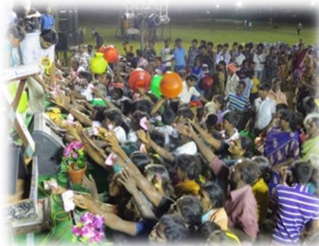
Waterpotten uitdelen tijdens de campagne